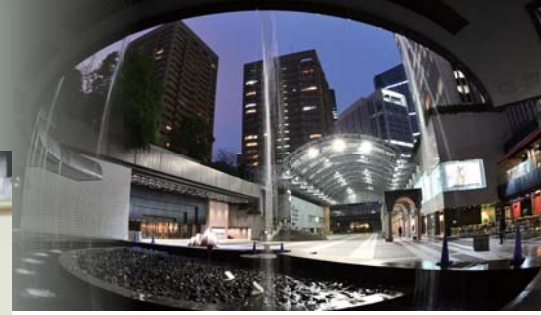
サントリーホール